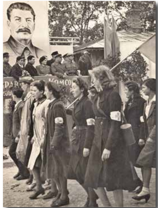
26. Камсамольскі мітынг у г. Гродна. 1940 г.