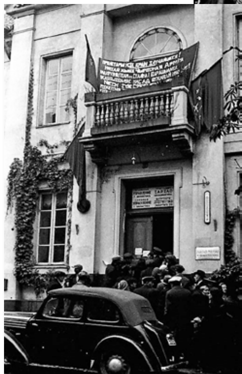
17. Уваход у Часовае ўпраўленне г. Беластока. Кастрычнік 1939 г.