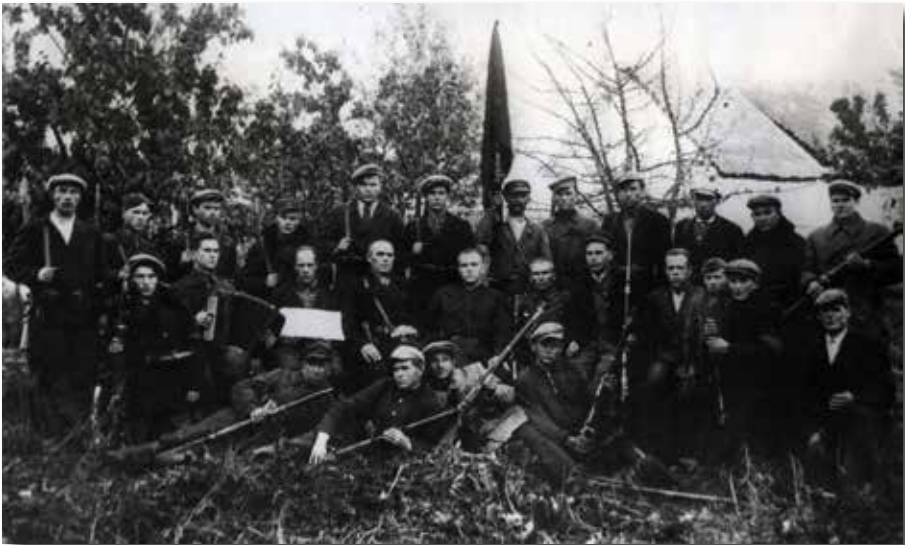
4. Удзельнікі Скідзельскага «пайстання». Канец верасня 1939 г.