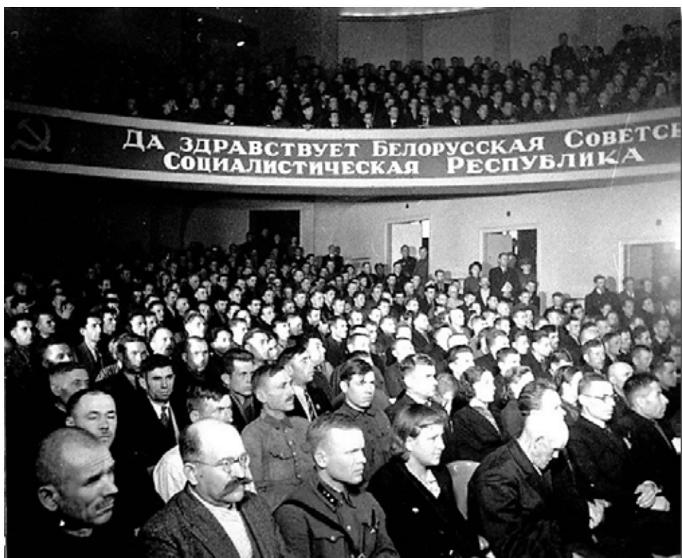
21. Пасяджэнне дэлегатаў Народнага схода Заходняй Беларусі