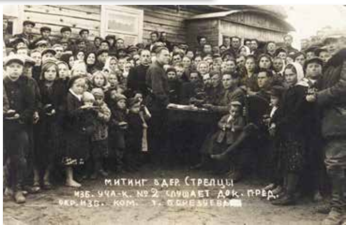
12–14. Мітынгі ў Гродне і вёсках Беластоцкай вобл. падчас выбараў дэлегатаў у Народны сход Заходняй Беларусі