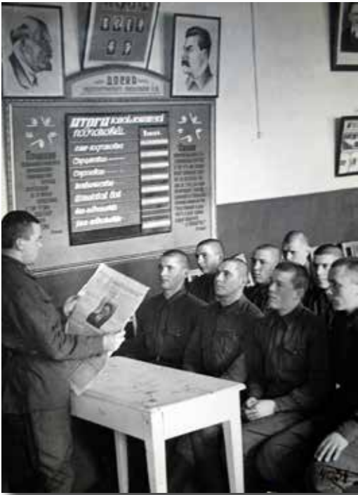
25. Палітычны занятак у вайскавай частцы. 1940 г.