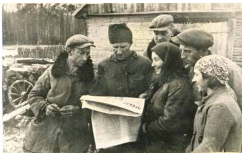
23–24. Пропагандысцкія здымкі сялян, якія галасуюць за перадзел памешчыцкіх земляў і чытаюць савецкія газеты