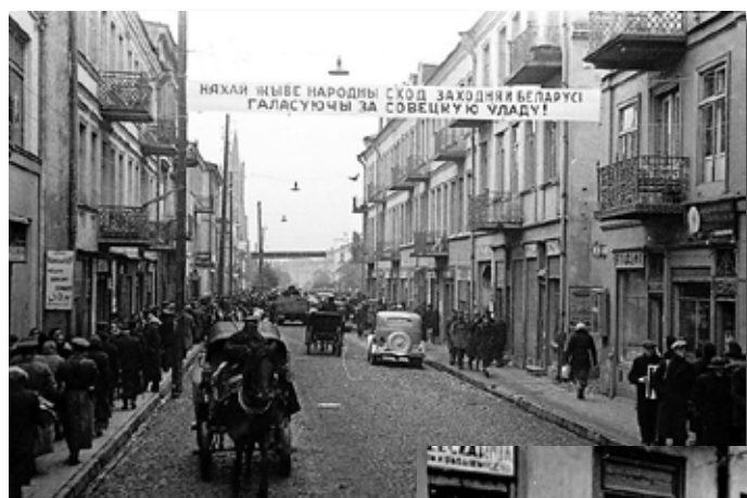
15–16. На вуліцах Беластока. Кастрычнік 1939 г.