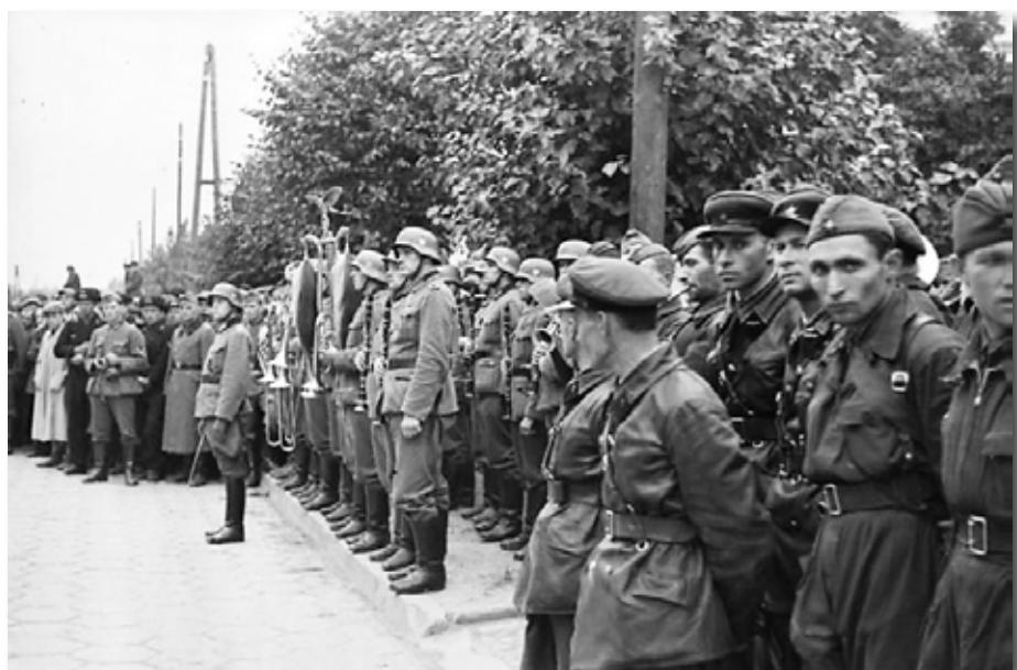
5–7. Салдаты і афіцэры Чырвонай арміі і Вермахта падчас сумеснага вайсковага парада ў Брэсце. 23 верасня 1939 г.