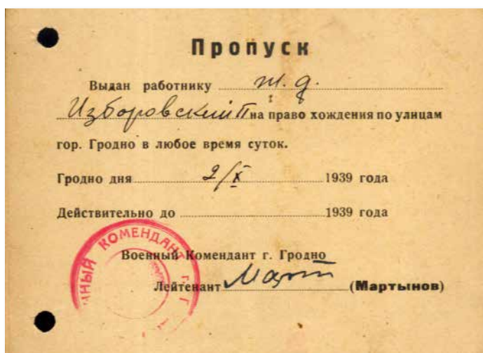
9. Пропуск П. Избаройскага на права кругласуткавага знаходжання на вуліцах г. Гродна