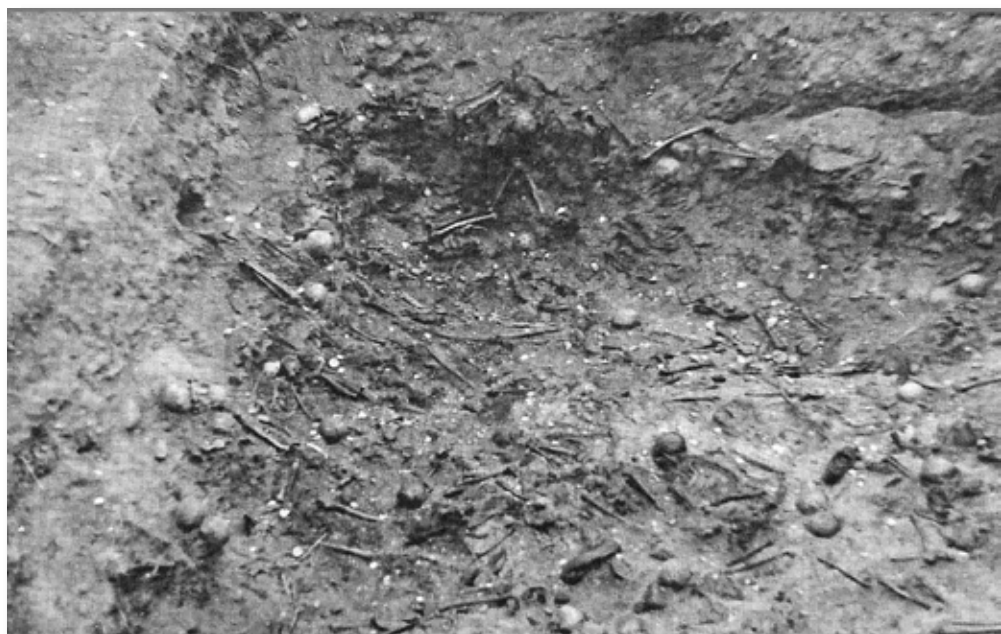
29. Курапаты. Эксгумацыя. 1997 г. Пахаванне №10.