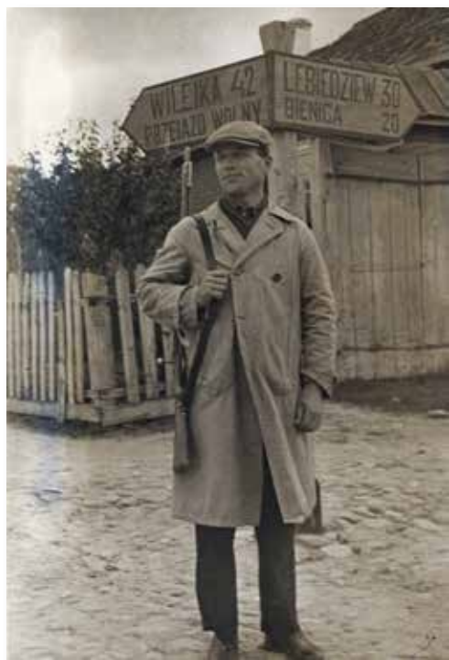
18–19. Байцы Рабочай гвардыі на вуліцах г. Вайкавыска і г. Смаргоні. Кастрычнік 1939 г.