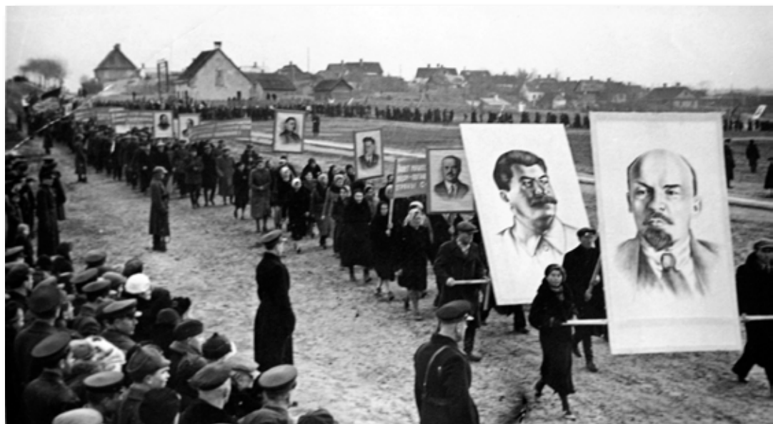
20. Святочная дэманстрацыя 7 лістапада 1939 г. Гродна