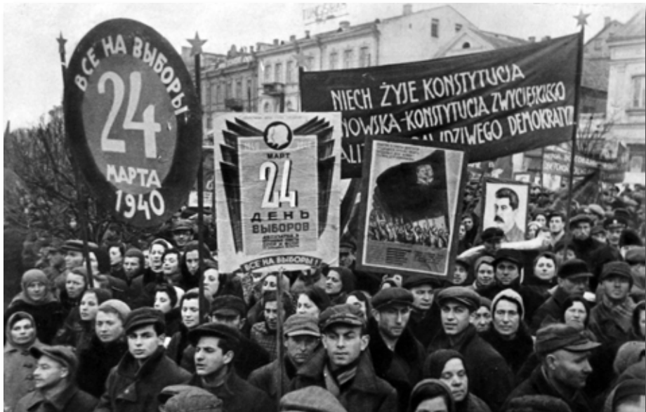
27. Мітынг у г. Беластоку падчас выбараў дэлегатаў Вярхоўных Саветаў СССР і БССР. Сакавік 1940 г.