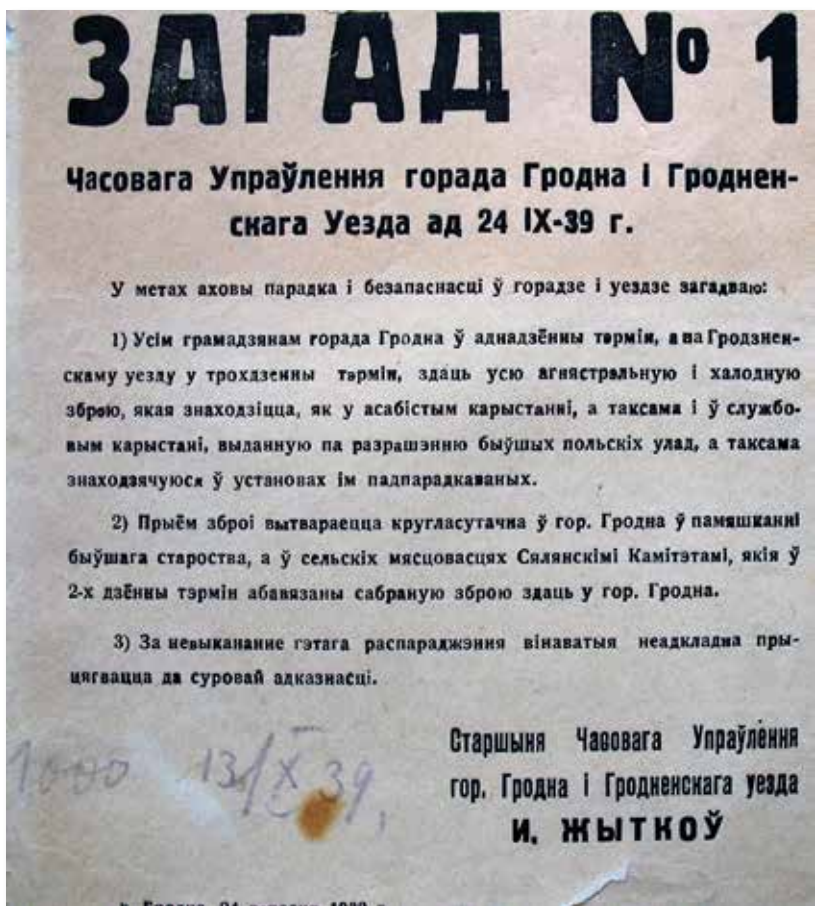
8. Загад Часовага ўпраўлення Гродна і Гродзенскага пав. пра тэрміновую здачу зброі. 24 верасня 1939 г.