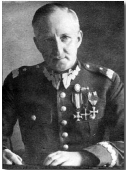
3. Генерал Юзаф Альшына-Вільчыньскі, расстраляны 22 верасня 1939 г. каля мяст. Сапоўкіна пад Гродна